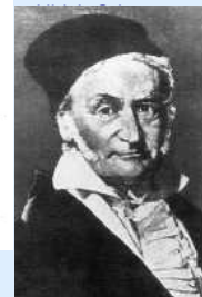
Carl Friedrich Gauß